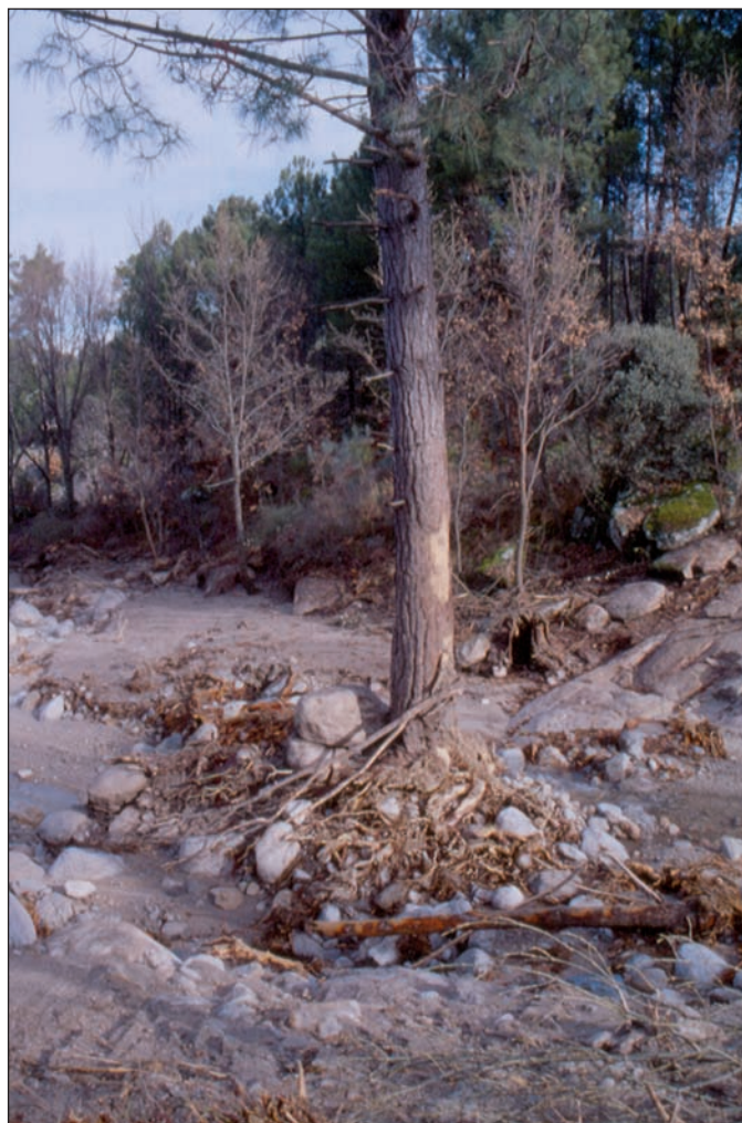
Figura 6. Ejemplo de indicio dendrogeomorfológico macroscópico: raíces expuestas por erosión de un banco de orilla durante un evento de avenida torrencial; pino resinero ( Pinus pinaster ) en las márgenes del arroyo Cabrera (Venero Claro, Sierra de Gredos oriental)

La medición de las muestras y la obtención de series dendrocronológicas datadas se lleva a cabo empleando equipos semiautomáticos, como la mesa de medición LINTAB (comercializada por la empresa Rinntech), asociada al programa TSAP-Win ( Time