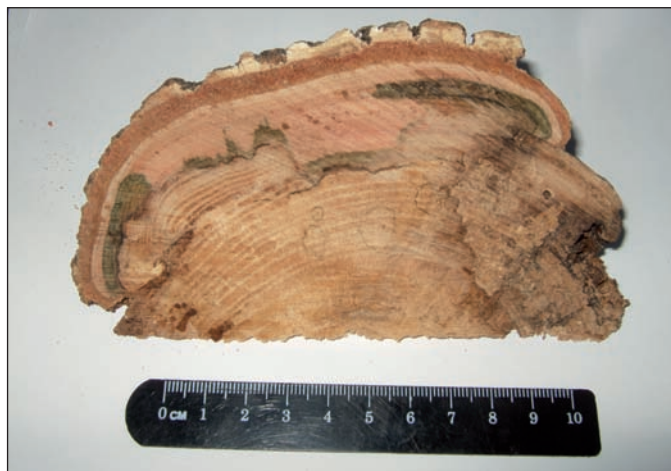
Figura 5. Ejemplo de indicio dendrogeomorfológico macroscópico: sección de una cuña extraída del callo formado en un descortezado por impacto (Figura 4); la disposición de los anillos en el callo nos permite reconocer, al menos, tres eventos sucesivos de avenida separados por unos pocos años; ejemplar de fresno ( Fraxinus angustifolia ) en la margen derecha del arroyo Cabrera (Venero Claro, Sierra de Gredos oriental)

Figure 4. Example of a macroscopic dendrogeomorphological evidence: damaged tree-crust due to the impact of the bed load (scar) and growth of a reaction callus. Several callus are found to grow inside older callus, indicating at least three torrential flooding events. Narrow-leaved Ash ( Fraxinus angustifolia ) on the right bank of the Cabrera stream (Venero Claro, eastern Sierra de Gredos)