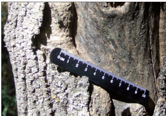
Figura 4. Ejemplo de indicio dendrogeomorfológico macroscópico: descortezado o descorchado por impacto de carga sólida de la corriente, con formación de un callo de reacción; varios bordes de callos inscritos unos dentro de otros, permiten reconocer al menos tres eventos de avenida torrencial; ejemplar de fresno ( Fraxinus angustifolia ) en la margen derecha del arroyo Cabrera (Venero Claro, Sierra de Gredos oriental)

Figure 3. Lined up examples of macroscopic dendrogeomorphological evidences. Fork-like bifurcations of shafts in alder trees ( Alnus glutinosa ) in the banks of Cabrera stream (Venero Claro, eastern Sierra de Gredos). Evidences apparently show a correlating level and the same age of a past flooding episode