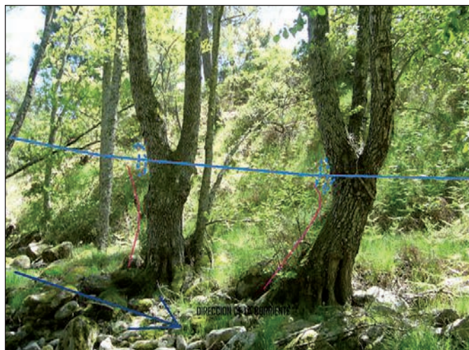
Figura 3. Ejemplos alineados de indicios dendrogeomorfológicos macroscópicos: bifurcaciones del fuste en horquilla; ejemplares de aliso ( Alnus glutinosa ) en las márgenes del arroyo Cabrera (Venero Claro, Sierra de Gredos oriental); parecen indicar un nivel correlacionable y una misma edad de un evento de avenida pretérito

Figure 2. Example of a macroscopic dendrogeomorphological evidence: adventitious candelabrum branches growth from a tilted and wrecked shaft; alder tree ( Alnus glutinosa ) in a longitudinal gravel bar in the Alberche river, in the neighbourhoods of Navaluenga (Ávila)