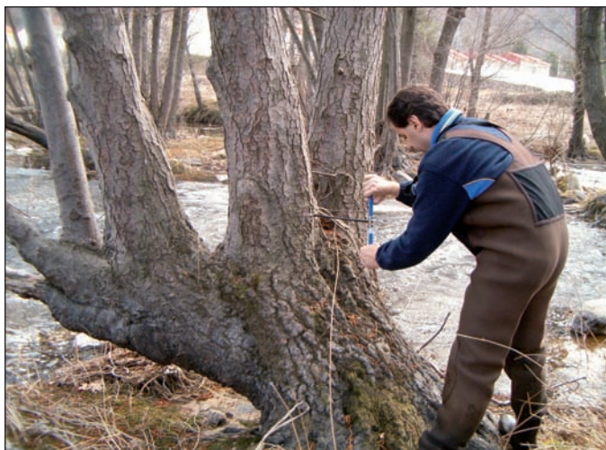
Figura 2. Ejemplo de indicio dendrogeomorfológico macroscópico: crecimiento de ramas adventicias en candelabro a partir de un fuste inclinado y partido; ejemplar de aliso ( Alnus glutinosa ) en una barra media longitudinal de gravas del río Alberche a su paso por Navaluenga (Ávila)

Figure 2. Example of a macroscopic dendrogeomorphological evidence: adventitious candelabrum branches growth from a tilted and wrecked shaft; alder tree ( Alnus glutinosa ) in a longitudinal gravel bar in the Alberche river, in the neighbourhoods of Navaluenga (Ávila)